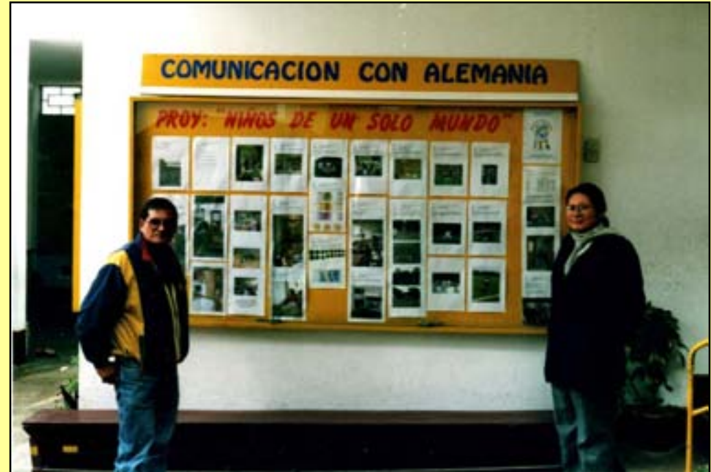
Ausstellung der Projektergebnisse in Erkrath und Lima